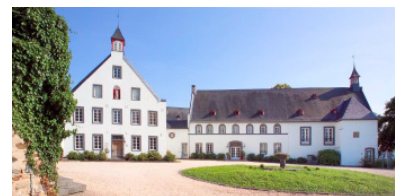
Seminarort: Klostergut Besselich in Urbar